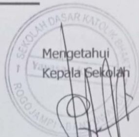
Laksmarion Moll, S.Komp NIP 1707/YK