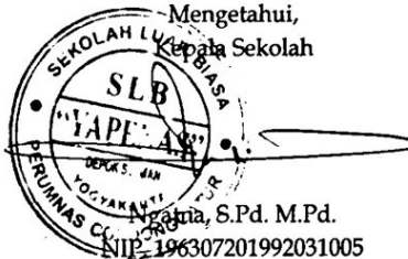
....., S.Pd. M.Pd. NIP. 196307201992031005